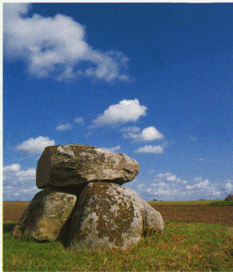
Runddysse ved Reerslev.

Dysser er fællesgrave. Det, vi ser i dag, er kun resterne af de imponerende gravanlæg ofte placeret meget tydeligt i landskabet. Måske var de også magtsymboler.