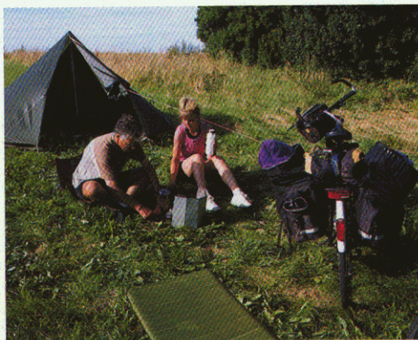
Lejrplads ved Vedsø Vang.