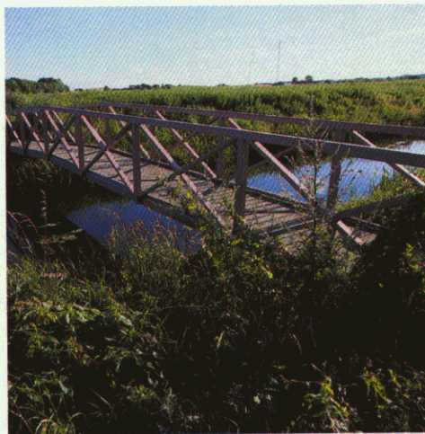
Jyderupstien krydser Åmose Å over en lille træbro.

Dette hæfte fortæller om natur- og kulturhistorien langs Jyderupstien. Til hvert detailkort er foreslået en tur med udgangspunkt i Jyderupstien. De vigtigste seværdigheder er omtalt i teksten og markeret med tal på kortet. Desuden er natur- og kulturhistoriske emner langs Jyderupstien kort beskrevet.