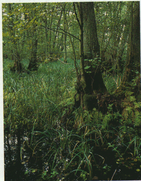
Ellesumpen ved Jyderup.

Jyderupstien passerer mange af disse stendiger. De er hjemsted for mange dyr og planter. Alle sten- og jorddiger er nu fredet.