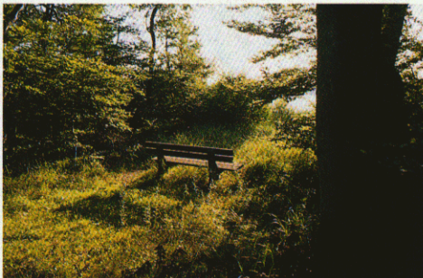
Dejlige omgivelser ved bredden af Skarresø.

På vestsiden af søen ligger Astrup Gods (6) , hvis hovedbygning stammer fra 1876. Gården var ladegård under Lerchenborg ved Kalundborg og blev først selvstændig hovedgård i 1852.